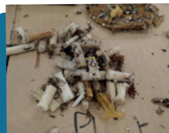
Mégots collectés lors d'une campagne de recensement des déchets sur les plages RAMOGE