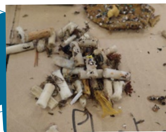
Mozziconi raccolti durante una campagna di littering sulle spiagge RAMOGE